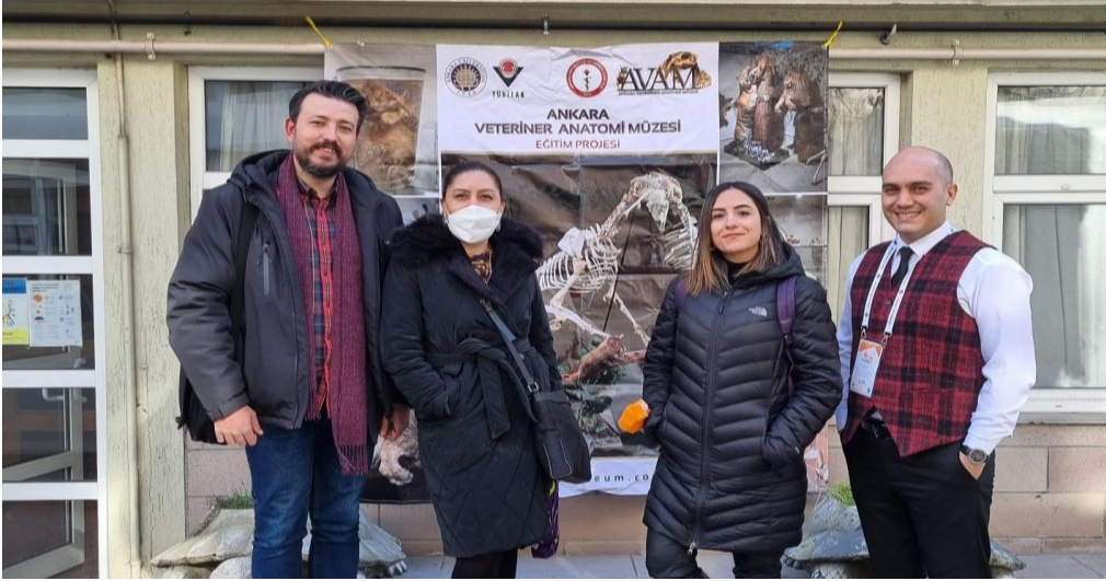
Doğa Tarihi ve Sağlık Müzelerinde Rehberlik Eğitimi 17-18 Mart 2022