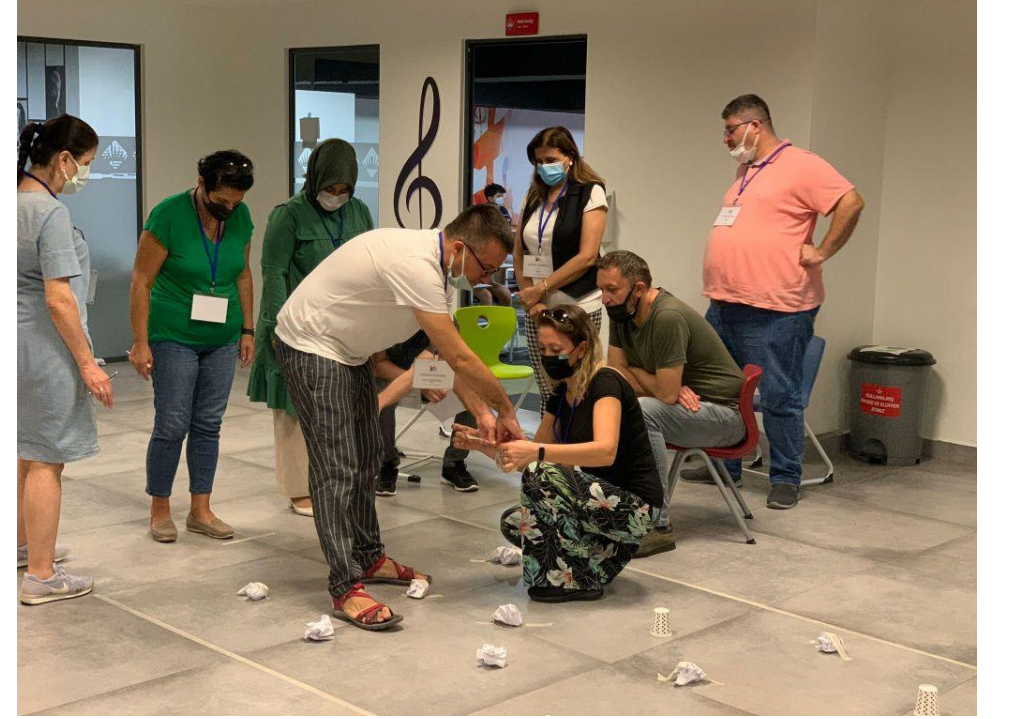
TÜBİTAK 4005 Drama alıřması