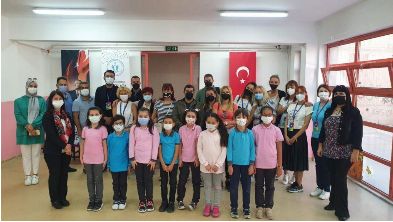
Avrupa Birliđi Erasmus+ KA229 Projesi Drama alıřması: “Learning With Creative Drama”