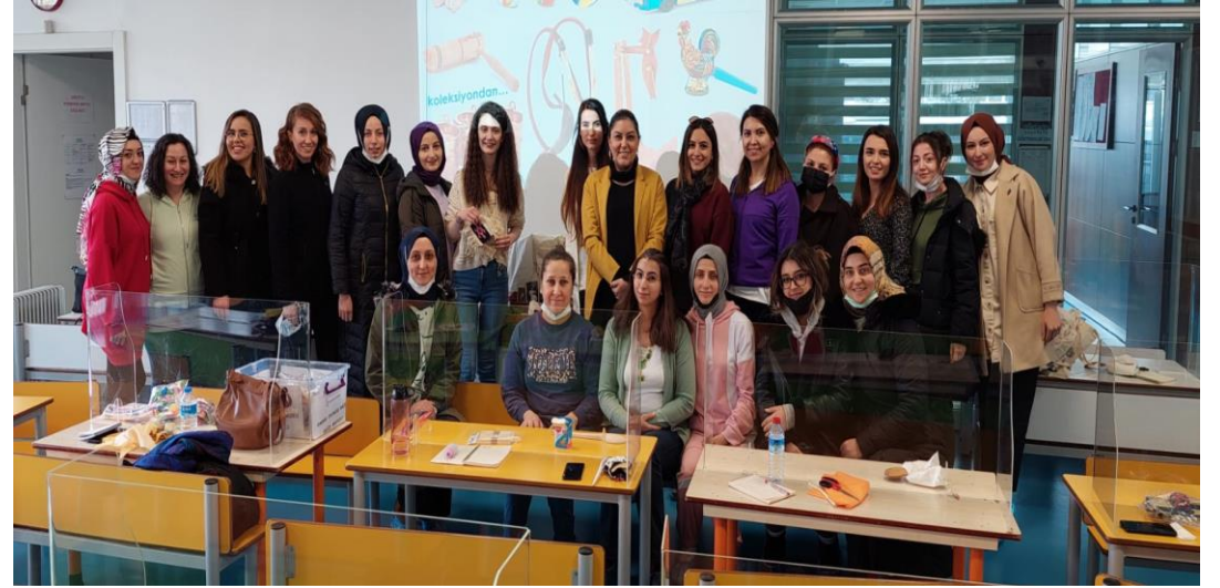
ASO1 Organize Sanayi Bölgesi Anaokulu Öğretmen Eğitimi 19 Mart 2022